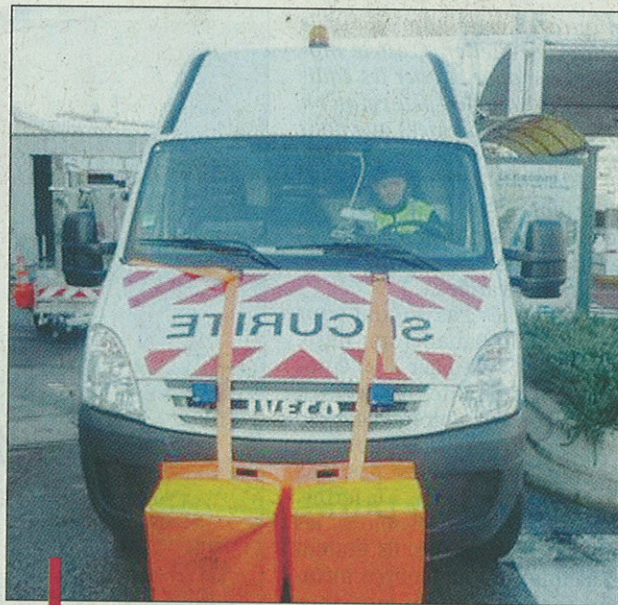
Prado-Carénage est équipé depuis longtemps, lui, de ce "camion-poussette", bien utile pour dégager un véhicule en panne.